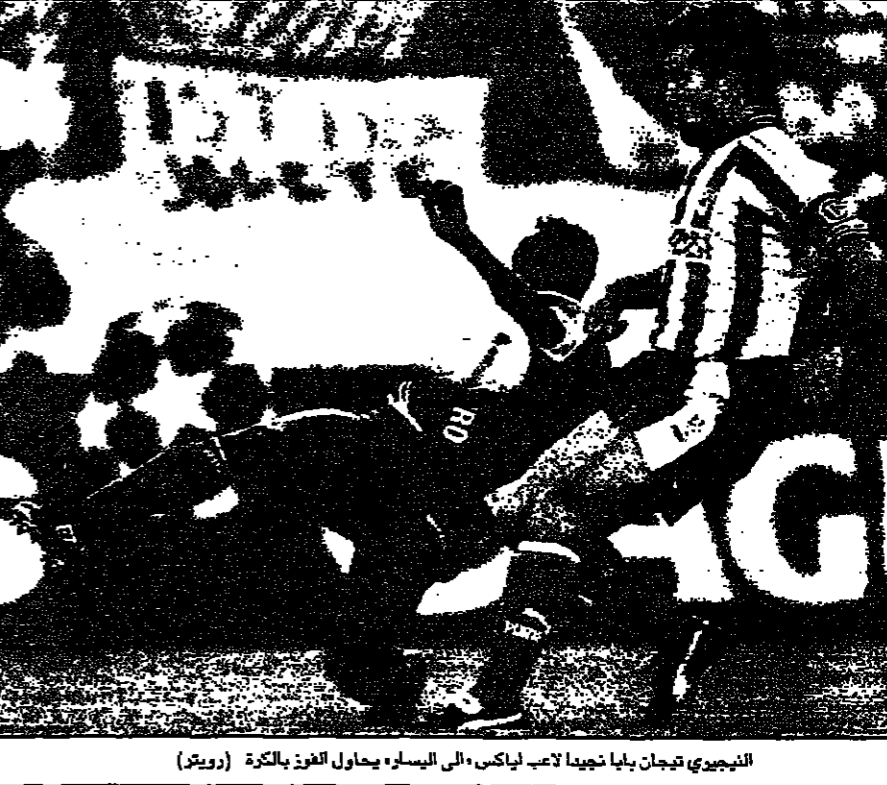
البريطاني تيجان بايا نجيبا لاعب اياكس الى اليسار يحاول الفوز بالكرة

برشلونة (اسبانيا) - اذ بدد في قضية كرويف امام المحكمة في برشلونة.